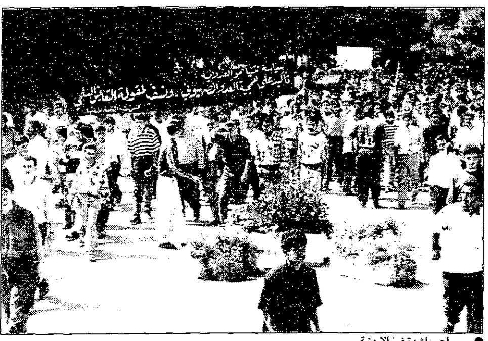
مسيرات حاشدة في الزنتية